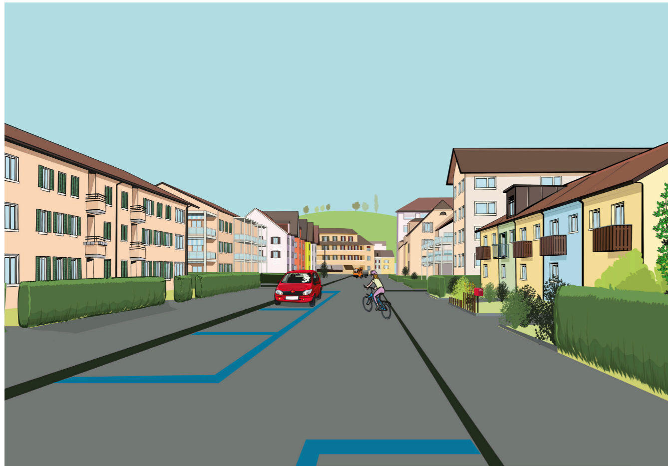
Quartierstrasse Blumenau vorher, Illustration: Jan Zablonier