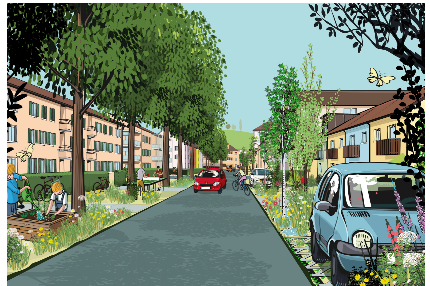
Quartierstrasse Blumenau nachher, Illustration: Jan Zablonier